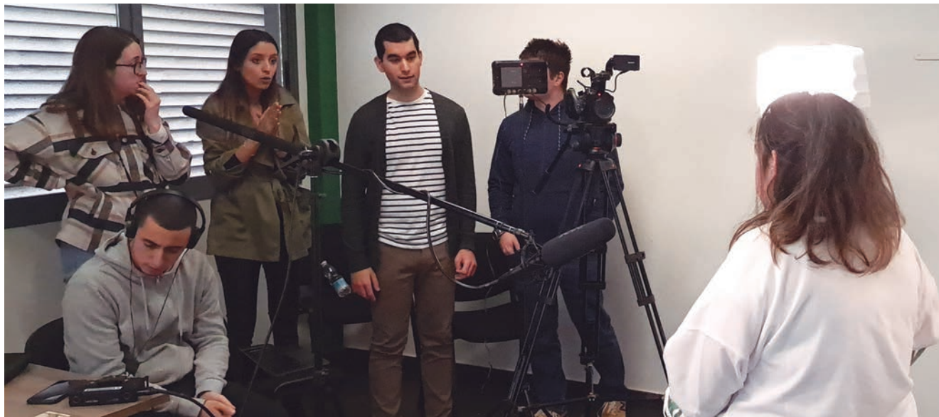
Los participantes en el proyecto grabaron sus videocurrículos.

34 aragoneses han participado un proyecto encaminado a renovar las metodologías para trabajar la inclusión laboral de las personas con discapacidad intelectual