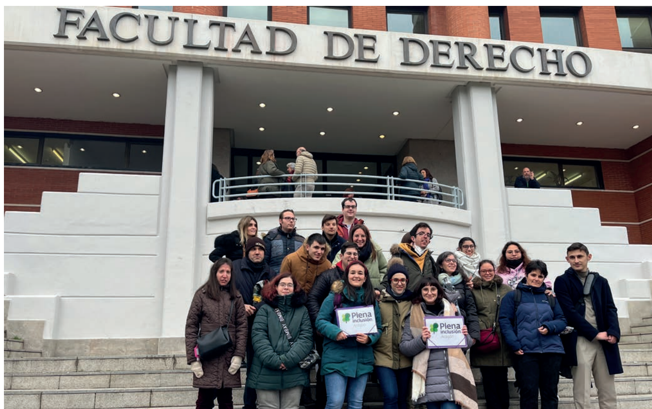
Opositores formados por Plena inclusión Aragón, el 18 de diciembre, en Madrid.

A mediados de diciembre, 41 de las personas que están preparando sus oposiciones con Plena inclusión Aragón pusieron a prueba sus conocimientos en un examen convocado en Madrid por el Ministerio de Política Territorial y Función Pública. Los miles de personas de todo el país que se presentaron al examen, en el que había en juego 234 plazas reservadas para personas con discapacidad intelectual en tareas complementarias de apoyo para oficinas de la Administración del Estado, continúan expectantes ante la próxima publicación de los resultados.