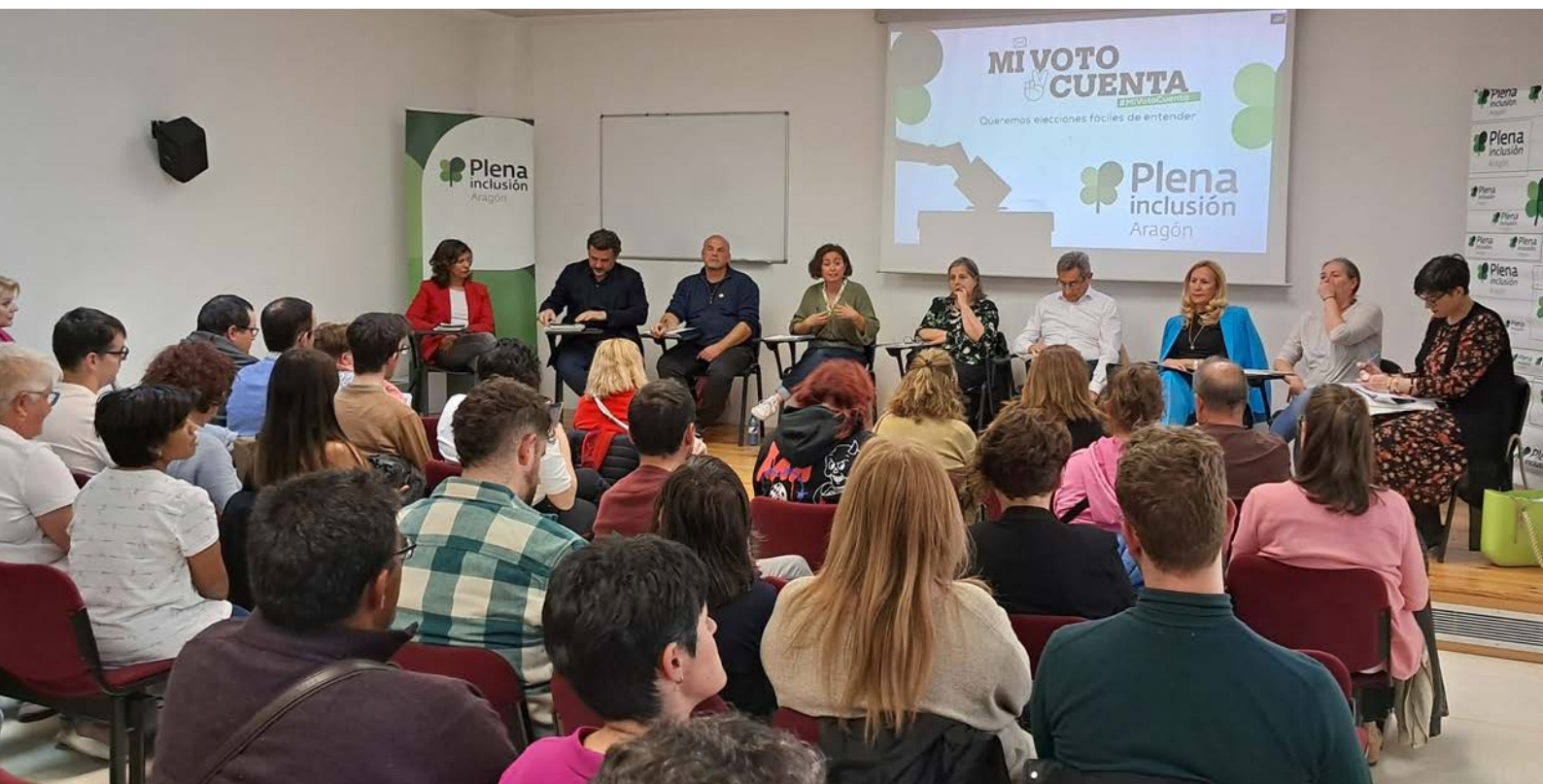
Encuentro con los partidos organizado por Plena inclusión Aragón antes del 28M

Además, las federaciones de Plena inclusión promueven desde hace años la distribución de señalética en lectura fácil en miles de colegios electorales con el fin de mejorar el acceso a este derecho. El 28M fue la primera cita electoral en la que el Ministerio del Interior experimentó (esta vez, solo en Madrid) con un sistema de señales sencillas de entender. Plena inclusión Aragón espera que esta cartelería cognitivamente accesible llegue a Aragón en la próxima cita electoral del 23 de julio.