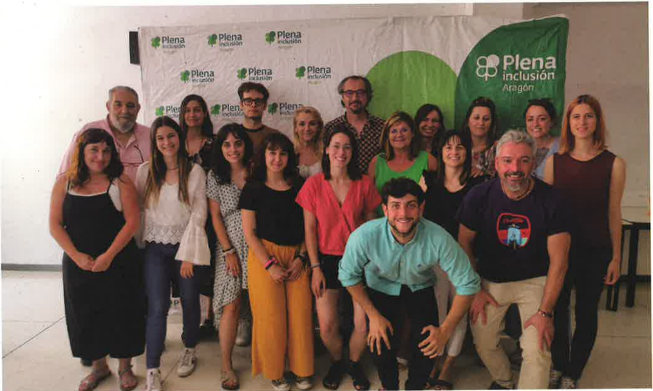
El equipo del proyecto Mi Casa en Aragón, profesionales de Plena inclusión Aragón y las entidades participantes.

Plena inclusión Aragón coordina, junto al Gobierno autonómico, Mi Casa, una experiencia piloto de viviendas para extraer aprendizajes orientados a la transformación de los servicios sociales residenciales para la discapacidad intelectual