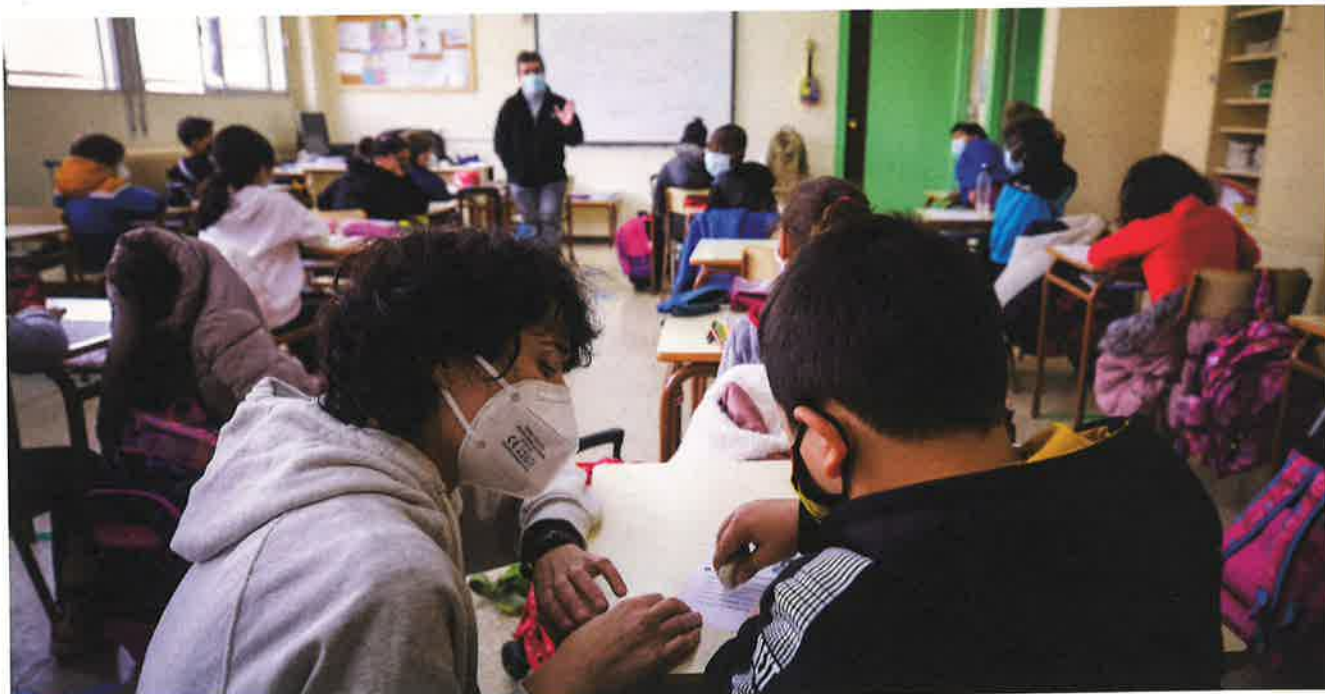
Ejemplo de un aula inclusiva en un colegio ordinario.