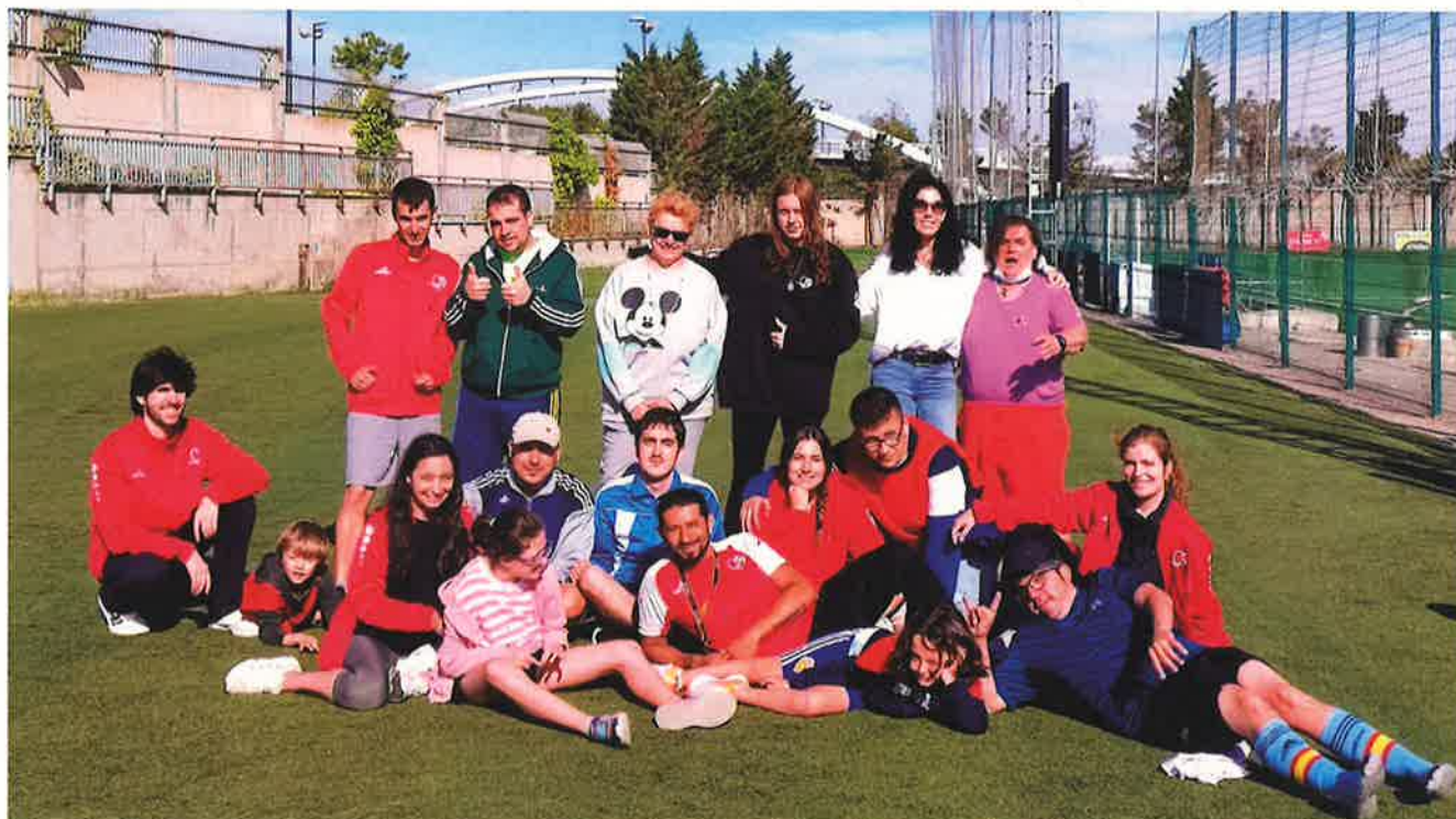
El campus deportivo de la Fundación Ser Más, una buena práctica para Plena inclusión.

Plena inclusión denuncia los continuos casos de discriminación de niños con discapacidad intelectual en colonias estivales y propone que sean más inclusivos