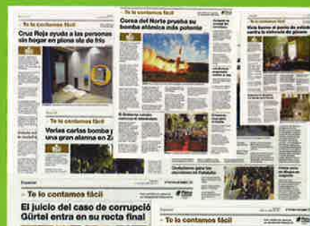
Se cumple el primer aniversario de la sección de noticias en lectura fácil publicada por el Periódico de Aragón