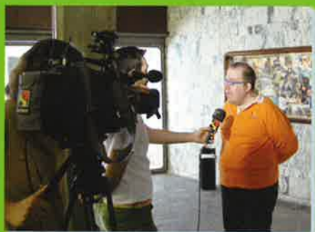
Uno de los actores de la película Campeones visita Zaragoza en unas Jornadas de sensibilización para trabajadores de FCC